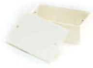
กล่องพักสายสี่เหลี่ยม 4x2 (164x77x50) สีขาว (BS) 20x2, 25x2 มม. (1/2'x2, 3/4'x2')