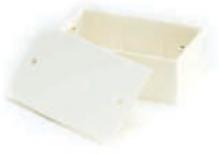
กล่องพักสายสี่เหลี่ยม 4x2 (164x77x38) สีขาว (BS) 16x2, 20-25 มม. (3/8'x2, 1/2', 3/4')