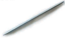
สปริงตัดท่อ-ร้อยสาย สีขาว (BS) 16-32 มม. (3/8'-1')