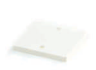
ฝาปิดกล่องพักสายสี่เหลี่ยม 4x4 สีขาว (BS) 75x75, 86x86 มม. (3x3', 3 1/2'x3 1/2')