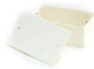
กล่องพักสายสี่เหลี่ยม 4x2 (141x50x40) สีขาว (BS) 20 มม. (1/2')