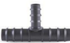
สามทางลดพีอีเอชดี 20x16 มม.