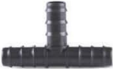
สามทางพีอีเอชดี 16-25 มม. (3/8"-3/4")