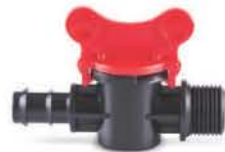
วาล์วทางปลาเกลียวนอกพีอีเอชดี 16-20 มม. (3/8"-1/2")