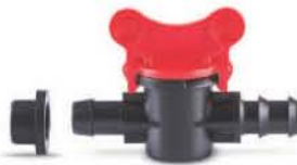
วาล์วเปอร์เมทพีอีเอชดี 16-20 มม. (3/8"-1/2")

ช.พานิช โทร. 02-115-9000 Line: @chopanich contact@chopanich.com