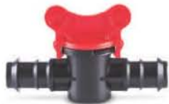
วาล์วพีอีเอชดี 16-25 มม. (3/8"-3/4")