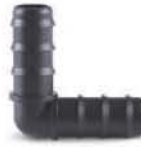
ข้องอ 90° พีอีเอชดี 16-25 มม. (3/8"-3/4")