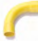
ข้อโค้ง 90° ช่วงสั้น ร้อยสาย 15-25 มม. (3/8"-1")