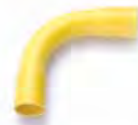
ข้อโค้ง 90° H ขาน 2 ร้อยสาย 15-100 มม. (3/8"-4")