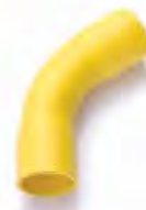
ข้อโค้ง 45° H ขาน 2 ร้อยสาย 15-100 มม. (3/8"-4")