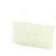
กล่องพักสายสี่เหลี่ยม 4x4 (86x86x40) สีขาว (BS) 20-25 มม. (1/2"-3/4")