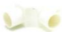
สามทางฝาเปิด-ร้อยสาย สีขาว (BS) 20-32 มม. (1/2"-1")