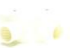
กล่องพักสายกลม 4 ทาง สีขาว (BS) 16-25 มม. (3/8"-3/4")