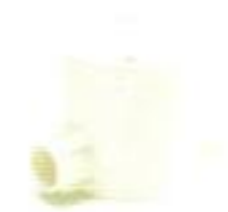
กล่องพักสายกลมเล็ก 2 ทางผ่าน สีขาว (BS) 16-25 มม. (3/8"-3/4")