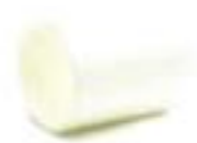
ข้อต่อตรง-ร้อยสาย สีขาว (BS) 16-50 มม. (3/8"-1 1/2")