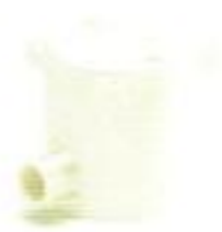
กล่องพักสายกลมเล็ก 1 ทาง สีขาว (BS) 16-25 มม. (3/8"-3/4")