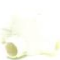
กล่องพักสายกลมเล็ก 3 ทางที่ สีขาว (BS) 16-25 มม. (3/8"-3/4")