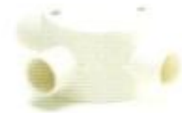
กล่องพักสายกลม 3 ทางที่ สีขาว (BS) 16-25 มม. (3/8"-3/4")