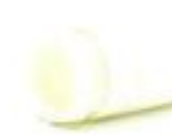
ข้อต่อเข้ากล่อง-ร้อยสาย สีขาว (BS) 16-32 มม. (3/8"-1")