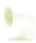
ข้องอ 90°-ร้อยสาย สีขาว (BS) 16-50 มม. (3/8"-1 1/2")