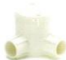
กล่องพักสายกลมเล็ก 2 ทางมุม สีขาว (BS) 16-25 มม. (3/8"-3/4")