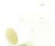
กล่องพักสายกลม 2 ทางผ่าน สีขาว (BS) 16-25 มม. (3/8"-3/4")