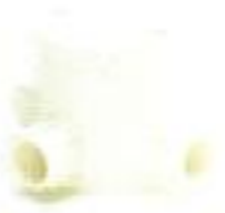
กล่องพักสายกลมเล็ก 4 ทาง สีขาว (BS) 16-20 มม. (3/8"-3/4")