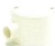
กล่องพักสายกลม 1 ทาง สีขาว (BS) 16-25 มม. (3/8"-3/4")