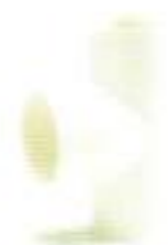
สามทาง-ร้อยสาย สีขาว (BS) 16-50 มม. (3/8"-1 1/2")