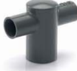
สี่ทางผ่าครอบลด - เกษตร เทา 25x18-100x55 มม. (1"x1/2"-4"x2")