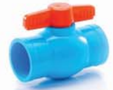
บอลวาล์ว 18-55 มม. (1/2"-2")