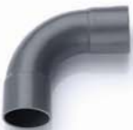
ข้อโค้ง 90° H บาน 2 เกษตร 10-55 มม. (1/4" - 2")