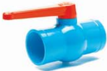
บอลวาล์ว 65-80 มม. (2 1/2"-3")