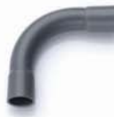
ข้อโค้ง 90° H บาน 2 เกษตร 10-25 มม. (1/4"-1")