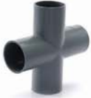
สี่ทาง - เกษตร เทา 25-80 มม. (1"-3") ยกเว้น 35, 65 มม. (1 1/4", 2 1/2")