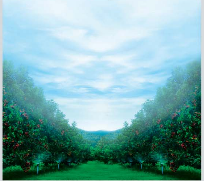
สวนเกษตร ดำน้ำหยด จ.จันทบุรี