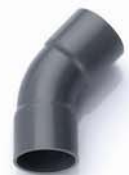
ข้อโค้ง 45° ลด ช่วงสั้น บาน2 เกษตร 10-55 มม. (1/4"-2")